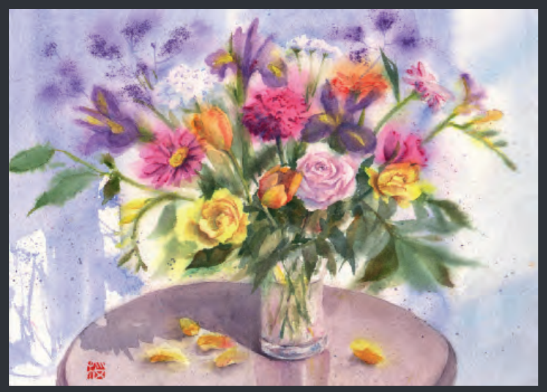
Sakura Misumi, England «Spring Bouquet» MUSEUM AQUARELLE

Nuancier - Farbkarte - Cartella colori - Carta de colores - カラーチャート